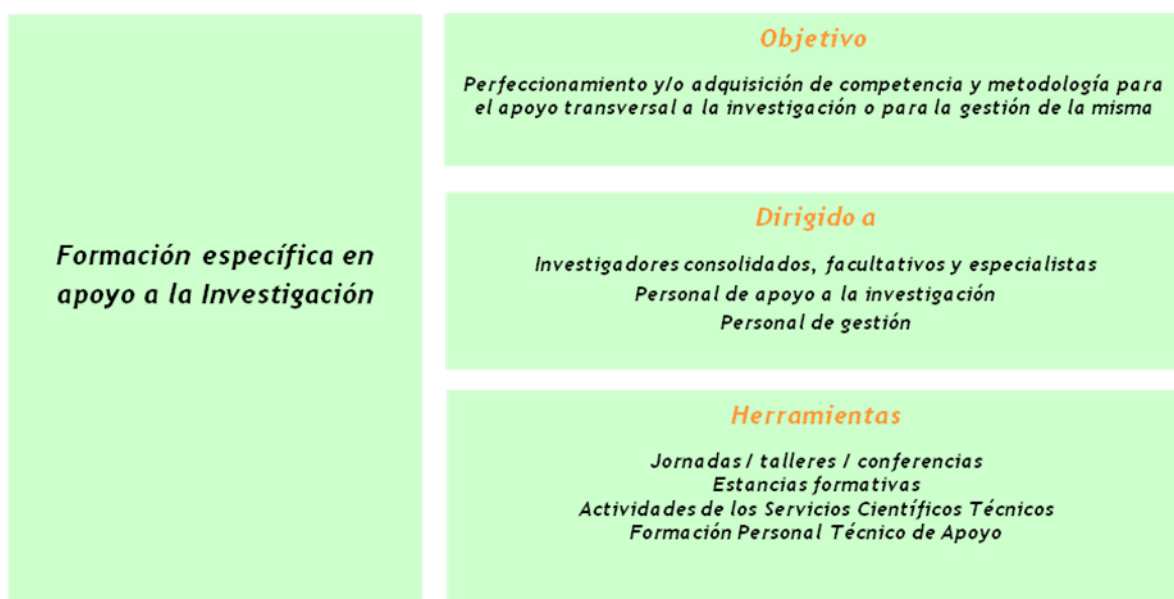
Figura 2: Esquema de de los objetivos, destinatarios y herramientas de formación, según la categoría de formación.